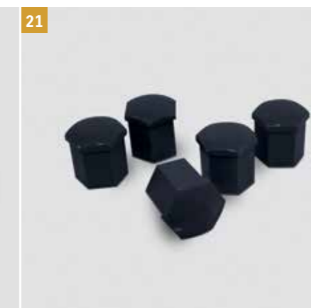
21 | Krytky šroubu kol