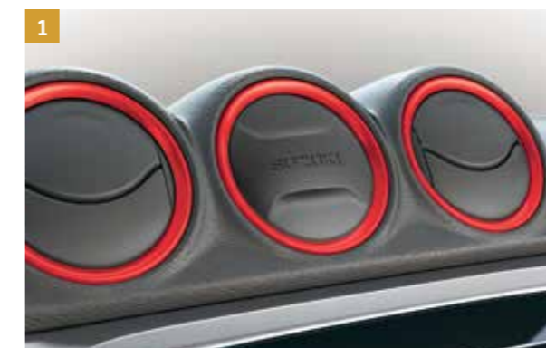
1 | Sada ozdobných kroužků výdechů klimatizace 1 Bright Red 5, sada šesti kusů. Objednací číslo 990E0-54P74-ZCF