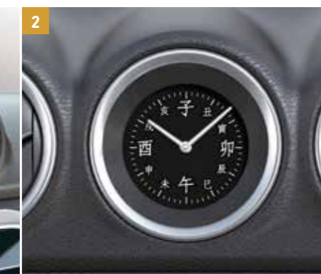
2 | Centrální hodiny „KANJI“ Bez středového rámečku hodin. Objednací číslo 99000-99053-CL4 Se středovým rámečkem hodin (stříbrným). Objednací číslo 99000-99053RCL2