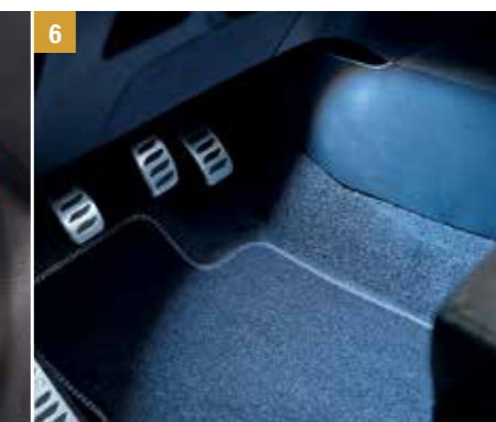
6 | Osvětlení prostoru pro nohy 3 Osvětlení podlahy v interiéru. Red Light (Bez ilustrace.) Objednací číslo 99000-99080-C16 Blue Light Objednací číslo 99000-99080-C17