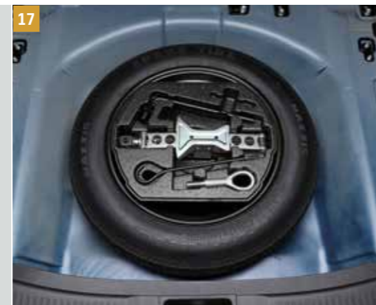
17 | Sada rezervního kola² WVTA 48V

Obsahuje pneumatiku, ventil, kolo, držák, informační leták, schránku s nářadím a zvedák.