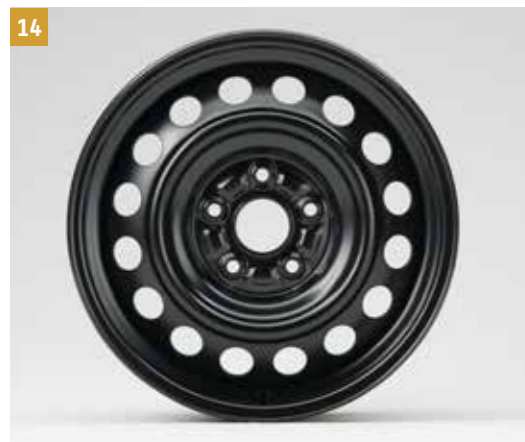
14 | Zimní ráfek 16"¹ 48V

Černý, ocelový, bez středového krytu kola.