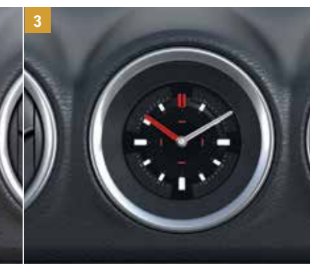
3 | Centrální hodiny „TOUGH“ Bez středového rámečku hodin. Objednací číslo 9921F-86R00-000 Se středovým rámečkem hodin (stříbrným). Objednací číslo 9921F-86R00R00