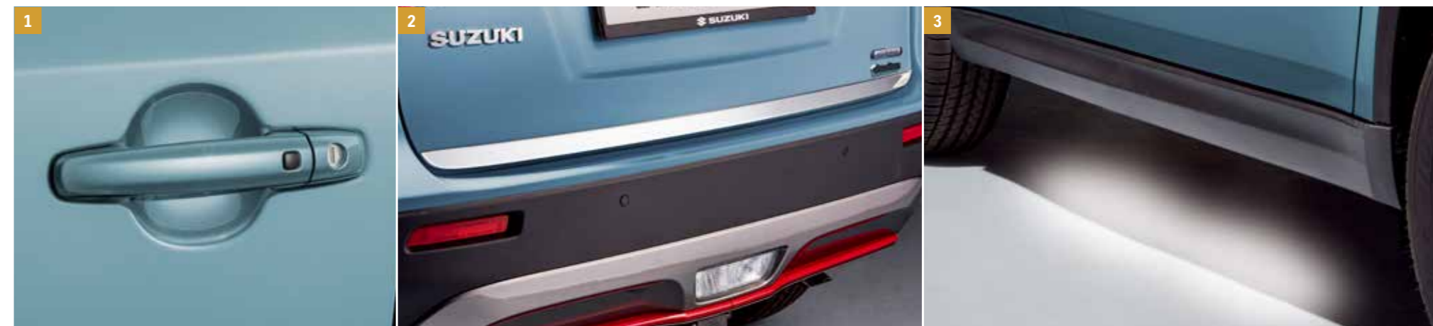
1 | Ochranná fólie kliky dveří Průhledná, chrání vaše vozidlo před poškrábáním. Sada čtyř kusů. Objednací číslo 99126-57T01-000