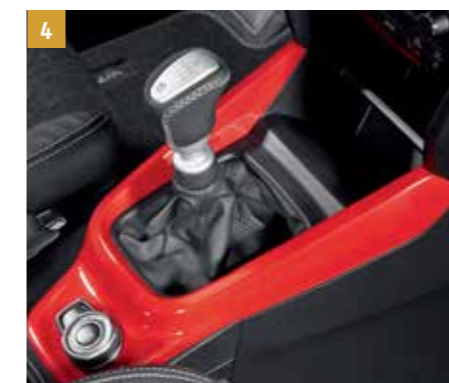
4 | Obložení středové konzole Bright Red 5, pro 4WD. Objednací číslo 990E0-54P78-ZCF Bright Red 5, pro 2WD. (Bez ilustrace.) Objednací číslo 990E0-54P77-ZCF