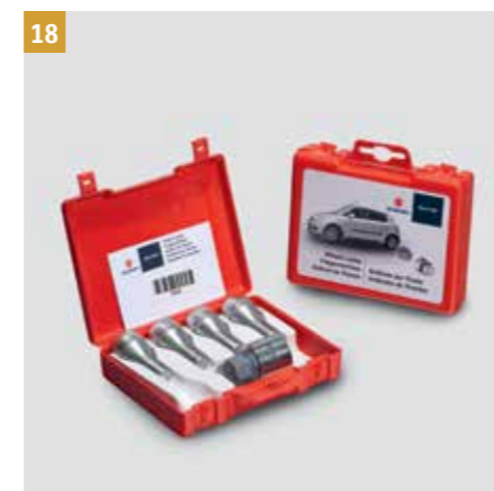
18 | Bezpečnostní šrouby kol „SICUSTAR“