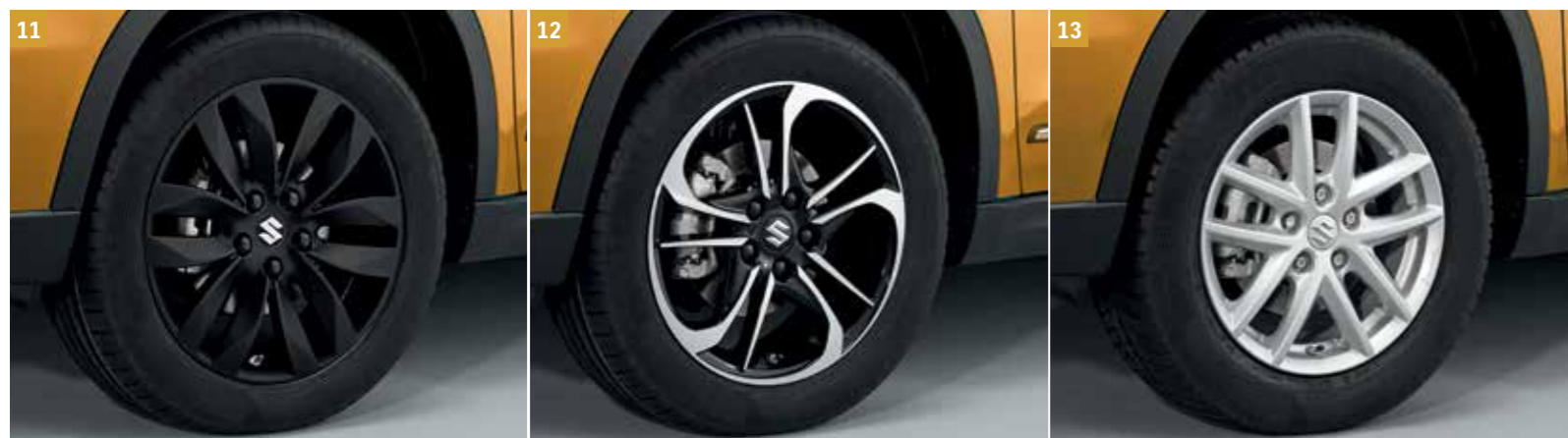
11 | Ráfek z lehké slitiny „MISTI“ WVTA

6,5 J × 17" vhodné pro pneumatiky 215/55 R17, včetně středové krytky s logem S.