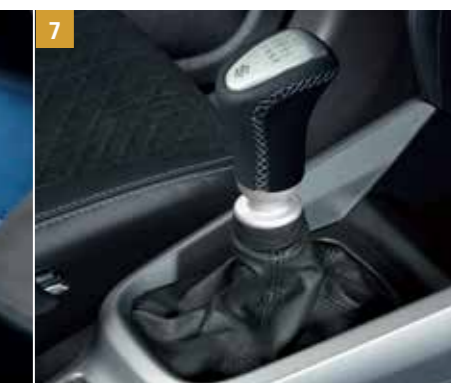
7 | Hlavice řadicí páky 48V Vhodné pro levostranné a pravostranné řízení, se stříbrnou vložkou a stříbrným stehováním. Pro vozidla s 6stupňovou manuální převodovkou. Objednací číslo 990E0-61M37-000