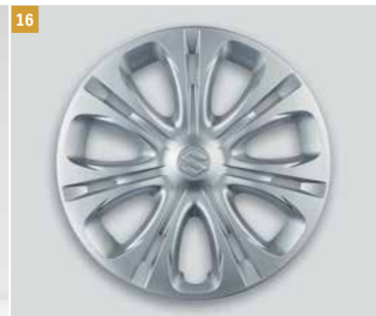
16 | Sada krytů kol 16"