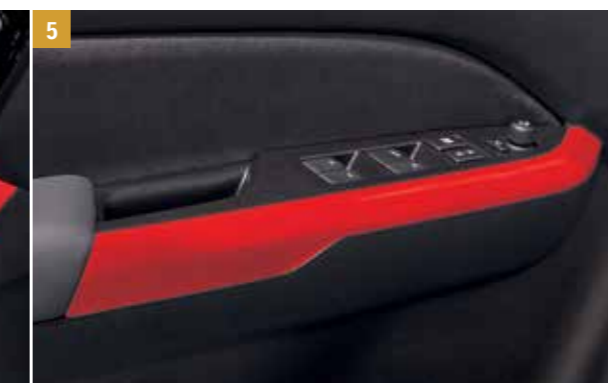
5 | Obložení lemu dveří 2 Bright Red 5, sada čtyř kusů. Objednací číslo 990E0-86R16-ZCF